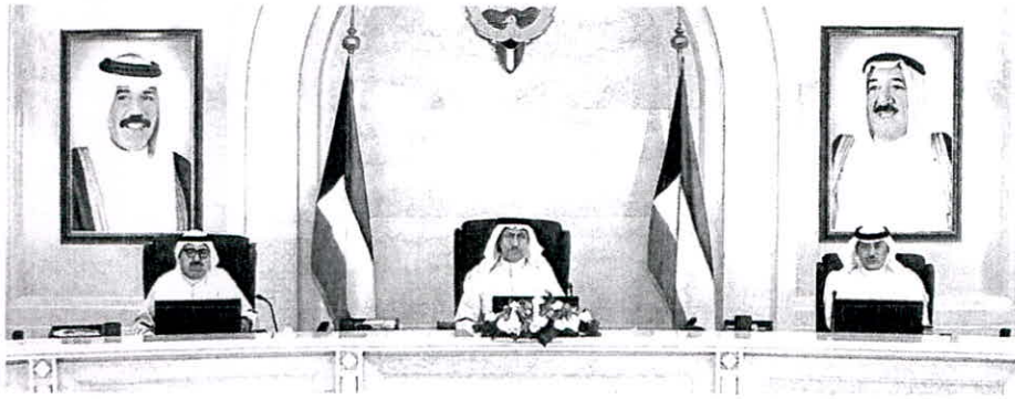
ال مبارك مبرئاً اجتماع مجلس الوزراء بين ناصر الصباح وصباح الخالد الكوينا

ارتفاع نسب إنجاز المشروعات عن مثيلاتها في العاملين الماضيين