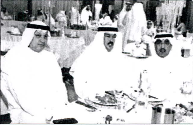
المضف والحمد والراشد خلال العمل

وذلك لتنفيذ رؤية سموه التتموية، وأضاف البريوج أن قطاع التدريب بالهيئة من القطاعات الكبيرة والفاعلة والتي كان لها دور كبير في الارتقاء بالعملية التعليمية والتدريبية في البلاد، معرباً عن «سعادته بحصول عدد من المعاهد على الاعتماد الأكاديمي، الأمر الذي يدل على تمعّن القطاع ودور كل منتسبيه في خدمة الوطن والارتقاء بمستوى التدريب لابنائنا المتدربين». ودعا «الجميع إلى تضافر الجهود والاستمرار في تالاق قطاع التدريب، وتذليل كل المعوقات التي تعوق المسيرة التدريبية، وأن يكون عضو الهيئة محل اهتمام من الإدارة العليا لينعم قطاع التدريب بالاستقرار الوظيفي والتطوير والارتقاء الدائم».